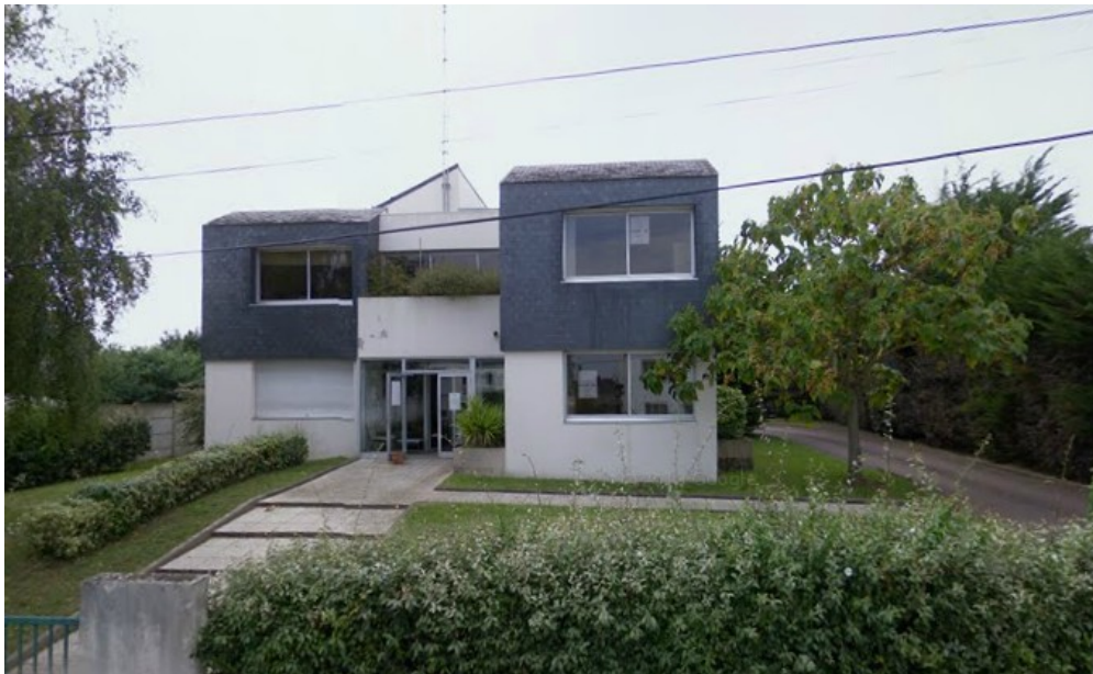
Le 7 Chemin du Relais.

L'initiative du PCP est de prendre comme horizon et d'accompagner la richesse des propositions et des démarches artistiques qui vont dans ce sens. La création est au cœur de nombreux débats (sociétaux) mais est souvent négligée dans ses impacts car elle est non perçue directement tout en étant, d'un autre côté, favorisée (les établissements d'enseignement artistique sont bien présents et foisonnants sur le territoire de la Loire-Atlantique, que cela soit dans le domaine des arts plastiques, que ceux de la musique, de la danse et des arts vivants).