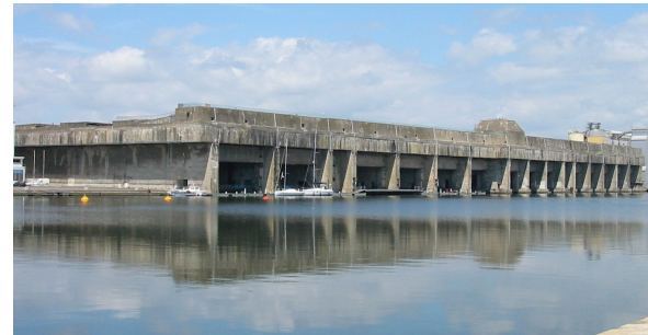
La base sous-marine et le port.