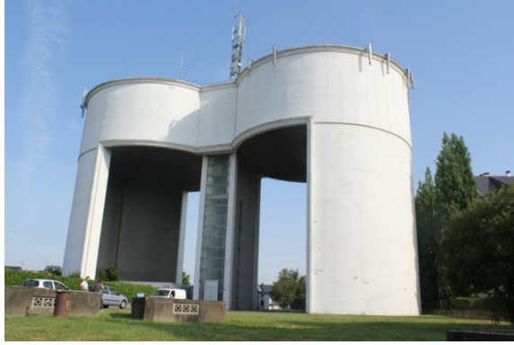
Le château d'eau du Moulin du Pé.