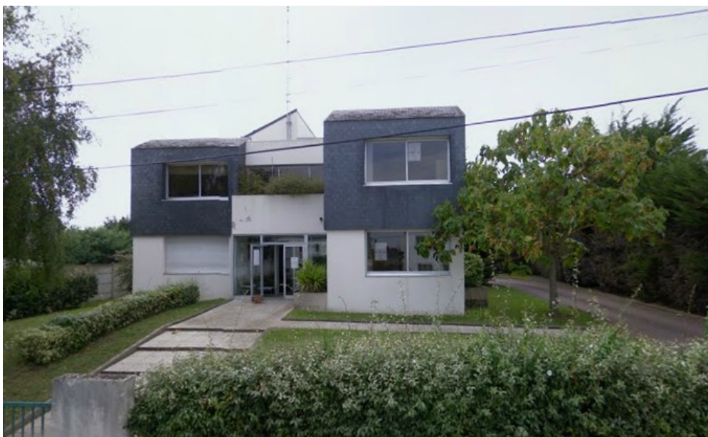
Le 7 Chemin du Relais.

Il est situé également juste à côté du château d'eau du Moulin du Pé, à l'architecture originale (1954) en forme d' "arc de triomphe" avec ses deux tours, et doté en tant que monument classé du label "Patrimoine du XX e siècle" (au même titre que la base sous-marine, la Soucoupe, et l'Hôtel de Ville de Saint-Nazaire). Le bâtiment du PCP était dédié antérieurement à des bureaux administratifs de la DDE (Direction Départementale de l'Équipement).