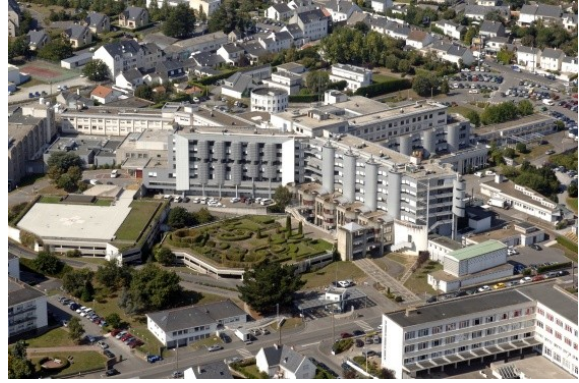
L'ancien hôpital de Saint-Nazaire.